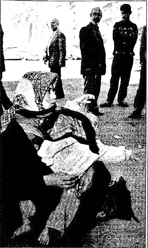
سيد عراقية تتسول في بغداد (بوختر)